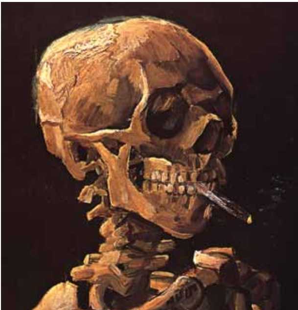
„Lobanja s tlečo cigareto“, Vincent Van Gogh, 1885.